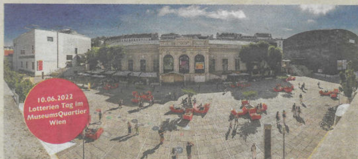
Wo Kunst und Kultur auf Café und Erholung trifft: Das MuseumsQuartier Wien. Am 10. Juni gibt's mit einem Spiel der Lotterien freien Eintritt.

Der 10. Juni ist als „Lotterien Tag“ wieder ein spezieller Tag für die Kunst und ihre Liebhaber